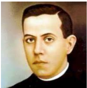
BL. MICHAŁ AUGUSTYN PRO

Michał urodził się w 1891 r. w Guadalupe de Zacatecas. Gdy w Meksyku antyklerykalny rząd rozwiązał wszystkie zakony Michał wyjechał do Europy, by studiować filozofię i teologię. Święcenia kapłańskie otrzymał w 1925 r., gdy w obliczu antychrześcijańskich nastrojów papież Pius XI ustanowił uroczystość Chrystusa Króla Wszechświata. Michał potajemnie odprawiał Msze święte, spowiadał, udzielał sakramentów i odwiedzał chorych. Wspomagał ubogich, organizując dla nich pomoc. Sam dostarczał im żywność, m.in. dźwigał worki z mąką. 22 listopada osądzono go i wydano wyrok śmierci. Zanim został rozstrzelany, przebaczył wszystkim, a gdy padł rozkaz do strzału, zawołał: "Niech żyje Chrystus Król", a pogrzeb był początkiem jego kultu. Uczestniczyło w nim - mimo zakazu - około 20 tysięcy wiernych. Ojca Pro beatyfikował św. Jan Paweł II 25 września 1988 r. razem z innymi męczennikami meksykańskimi początku XX wieku.